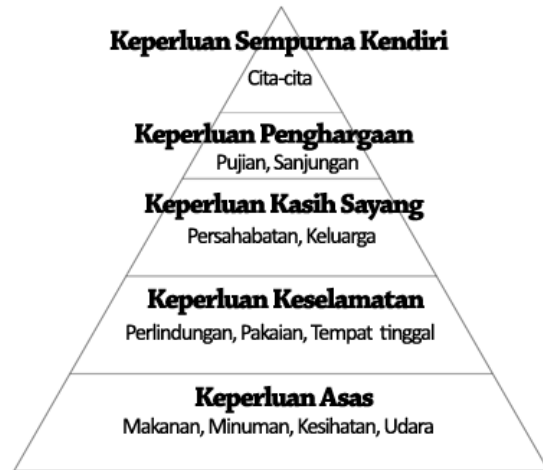
Rajah 1 Teori Keperluan Maslow (1954).

kejayaan dalam pendidikan. Dengan memahami teori keperluan Maslow, pengurusan murid B40 dapat diurus dengan lebih tepat mengikut tingkat keperluan manusia sebagai panduan yang akan menjadikan murid B40 lebih cemerlang dalam bidang pendidikan. Rajah 1 Teori Keperluan Maslow (1954).